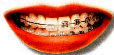
Auf der linken Seite sind die Brackets zahnfarben „getarnt“. Auf der rechten Seite sind sie aus Metall und gut sichtbar

Kosten: ab ca. 4.500 bis 12.000 Euro (je nach Material, Aufwand).